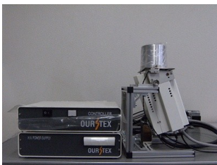
エネルギー分散型蛍光X線分析装置

試料中に種々の元素がどれだけ含まれるかを測定することができます。コンクリート中の塩分の量など、AIより大きな原子量の物質含有量を測定可能です。従来の方と異なり薬品を用いないので、現場にて測定することができます。その他に、土壌中の重金属などの汚染物質質量も測定が可能です。